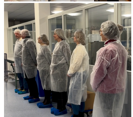
Einblick in die Produktion für die Seminarteilnehmer:innen