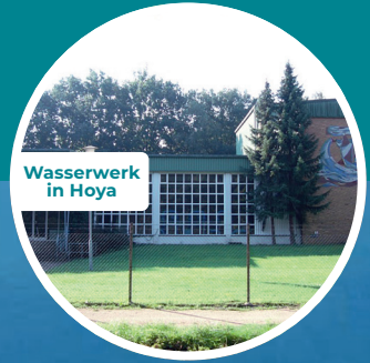
Wasserwerk in Hoya

... die Trägerlösung der Wirkstoffe der meisten unserer Darreichungsformen gereinigtes Wasser ist, welches aus dem Trinkwasser der Wasserversorgung Samtgemeinde Grafschaft Hoya hochrein aufbereitet wird?