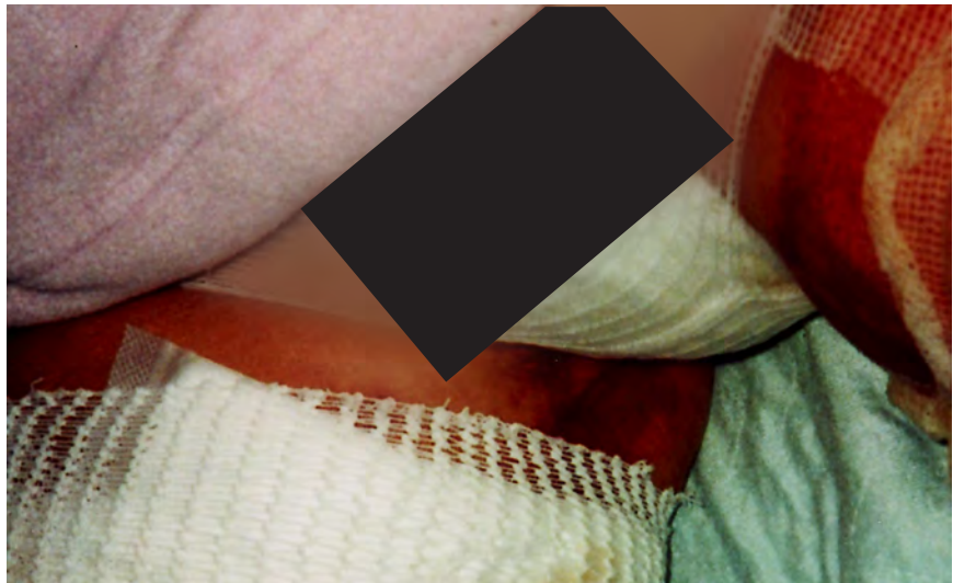
Abb. 2: Zustand nach 24 Stunden