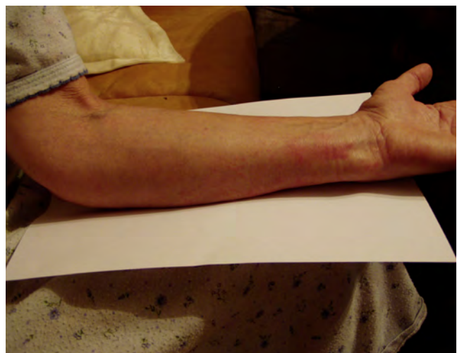
Abb. 10: 6 Stunden nach der Verbrühung