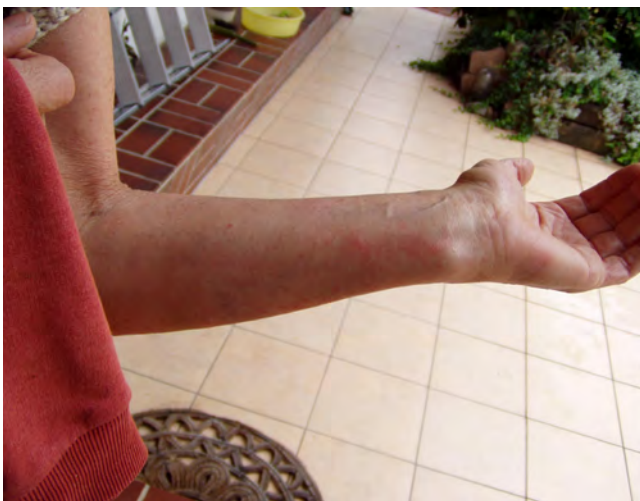
Abb. 9: sofort nach der Verbrühung

Ein abschließendes Bild (Abb. 8) konnte am 11. Oktober 2011 ge-