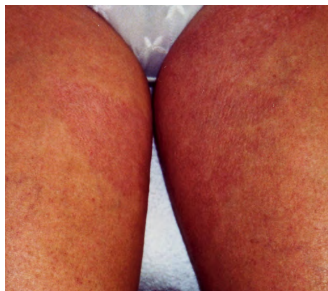
Abb. 6 und 7: Wundheilung nach 3 Monaten