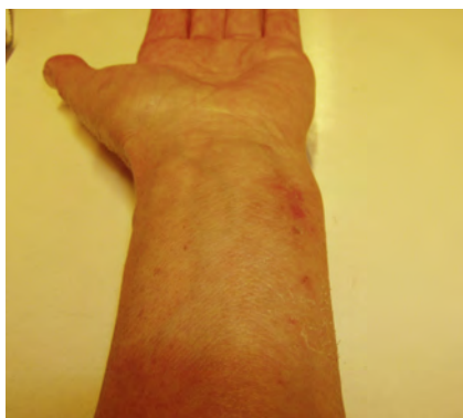
Abb. 13: Heilung

Die Brandblase (Abb.11,12) jedoch war, nachdem sie sich von selbst innerhalb von weiteren 6 Stunden geöffnet hatte, überhaupt nicht schmerzhaft und nässend, wie man es sonst gewöhnlich antrifft. Da die betroffene Stelle in einem Bereich lag, der durch das Waschen der Hände und den täglichen Abwasch in der Küche sehr leicht benetzt und gereizt wird, war diese Reaktion umso erstaunlicher. Die Wundheilung