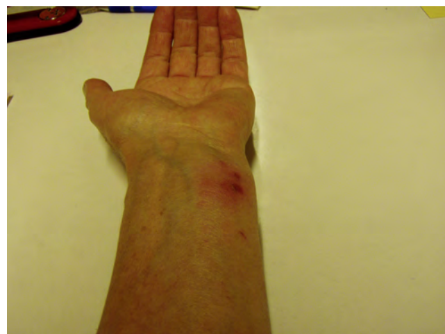
Abb. 11 und 12: Brandblase