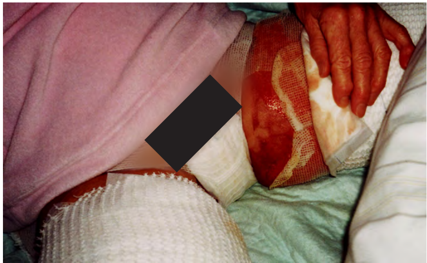
Abb 1: Zustand nach 24 Stunden

Aufgrund der Symptomatik hielt ich die Einnahme von rechtsdrehender Milchsäure für ratsam. Die Patientin nahm RMS® Tropfen (Fa. Asconex) 2x tgl. 40 mit viel warmem Wasser schluckweise. Zusätzlich sollte sie täglich 2x 2 Tabletten SANUVIS lutschen. Damit wollte ich die starke Gewebsübersäuerung im Wundgebiet lindern. Zusätzlich bekam sie Quinomit® (Fa. MSE) 2x 2 Hübe tgl.. Bei diesem Mittel handelt es sich um ein Q10-Präparat, das als Nano-Quinol (aktive Form des Q10) oral gegeben werden kann, um die Mitochondrienfunktion und Wundheilung im Körper anzuregen. Der Ehemann wurde angehalten, seiner Frau möglichst viel resveratrol- und