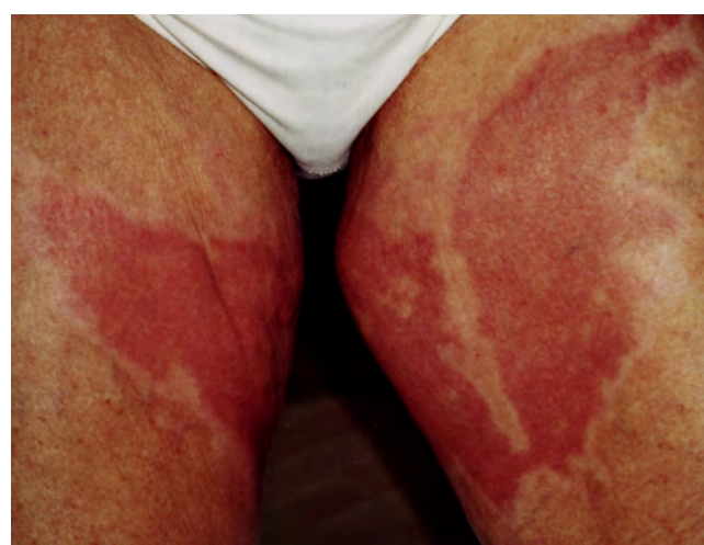
Abb. 4 und 5: Zustand 50 Tage nach der Verbrennung