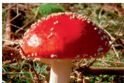
Abb. 1: Amanita muscaria

( Amanita muscaria , Agaricus muscarius , der Fliegenpilz)