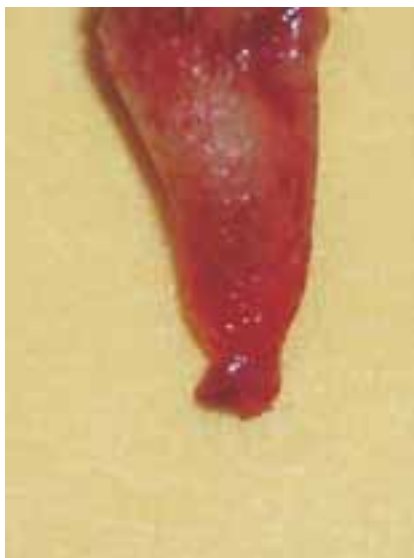
Abb. 4: Zahngranulom

feldes ist beschriftet. Sicherlich war meist der energetische Fluss auf einem Meridian durch den erkrankten Zahn bereits gestört, doch jetzt beginnt der Körper mit massiven Gegenreaktionen (siehe Abb. 4).