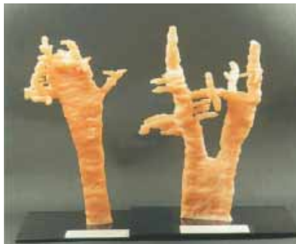
Abb. 2: Wurzelkonfigurationen nach MEYER 1955