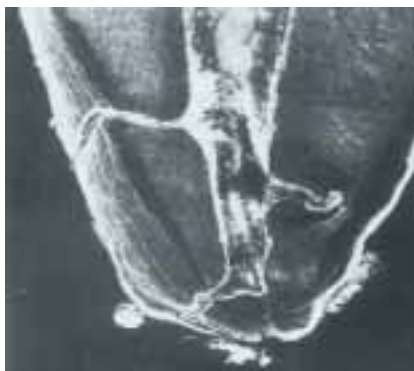
Abb. 5: „Delta“ an der Wurzelspitze

Eine weitere Problematik zeigt sich besonders an dem Apex des Zahnes, an der Wurzelspitze. Hier spricht man vom „Delta“, angelehnt an Flussmündungen, die ähnliche Formen zeigen (siehe Abb. 5).